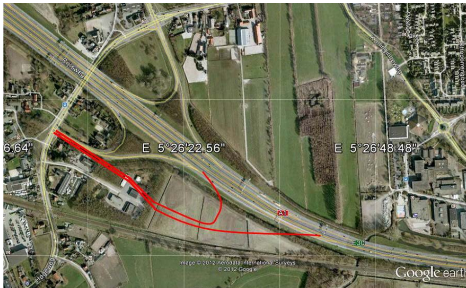
Figuur 3: Vershoven afrit.

Op blz. 17 van deze bijlage geeft RWS aan: “Het alternatief verschoven afrit scoort verkeerskundig vrijwel gelijk aan het voorkeursalternatief” 4 . Verderop op die blz. wordt gemeld: “De extra kosten voor dit alternatief bedragen naar schatting 1 miljoen euro, exclusief de kosten van grondaankoop en de kosten voor de bij dit alternatief nodige aanpassing van het onderliggende wegennet (OWN).” Dan volgt de – voor de SHB&L verbazingwekkende- conclusie “Nu de effecten van dit alternatief in het kader van het WAB niet positiever zijn dan de effecten van het voorkeursalternatief (VKA) is er geen aanleiding voor dit alternatief verschoven afrit te kiezen”.