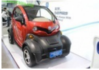
Rayttle E28 doet een Renault Twizy na