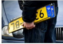
Kans op chip tegen diefstal kentekenplaat