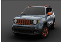
Mopar met twee dikke Jeeps Renegade in